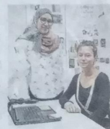
Attività allo sportello

IERI a Empoli è stata inaugurata una realtà nuova. Un'iniziativa che favorisce l'inclusione sociale e un aiuto concreto a tutte le persone in difficoltà, in tutti i comuni dell'Empolese Valdelsa. Parliamo dello sportello informativo gratuito «Donyasso», gestito da Oxfam e Asev, che fornirà un supporto nell'accesso ai servizi offerti dal territorio e attività mirate al contrasto della dispersione scolastica e all'integrazione degli stranieri sul territorio. Una vera e propria «Casa della Conoscenza», dove i cittadini italiani e stranieri potranno avere informazioni sulle normative in materia di immigrazione e non solo. Si potrà avere aiuto informativo per le richieste di protezione internazionale e rimpatrio volontario assistito; sui corsi di lingua e formazione professionale; sulle attività del doposcuola e animazione interculturale; sull'accesso alle prestazioni sociali. «L'apertura dello sportello per favorire l'integrazione dei cittadini stranieri - ha detto il sindaco di Fucecchio Alessio Spinelli - rappresenta una grande opportunità di inclusione sociale a beneficio di tutta la cittadinanza».